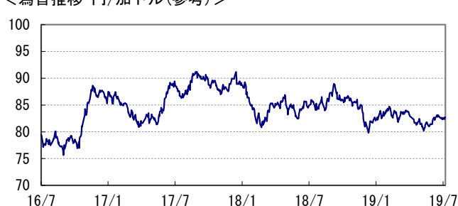
<為替推移 円/加ドル(参考)>

※当レポート中の各数値は四捨五入して表示している場合がありますので、それを用いて計算すると誤差が生じることがあります。