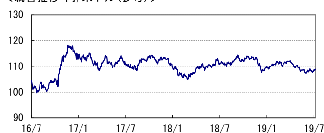
<為替推移 円/米ドル(参考)>

※当レポート中の各数値は四捨五入して表示している場合がありますので、それを用いて計算すると誤差が生じることがあります。